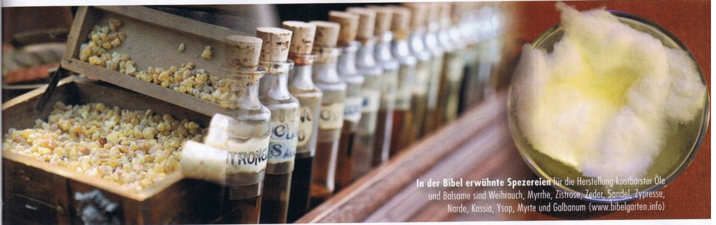
In der Bibel erwähnte Spezereien für die Herstellung kostbarer Öle und Balsame sind Weihrauch, Myrrhe, Zistrose, Zeder, Sandel, Zypresse, Narde, Kassia, Ysop, Myrte und Galbanum ( www.bibelgarten.info )

württembergische Manufaktur Labdanum Tel. 07159/45101 ( www.labdanum.de ) an. Ein Stabilisierungs- und Schutzöl ist das Nardenöl. Früher diente es der Herstellung des Heiligen Salböls, das Priestern, Königen und Eingeweihten vorbehalten war. Das Öl umfängt den Gesalbten wie mit einem schützenden Hauch und lässt ihn tief in sich eine wissende Ruhe spüren.